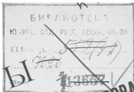
Рис. 1. Штамп библиотеки ЮУО РГО с текстом «Библиотека Ю.-Усс. Отд. Русс. геогр. об-ва»

1. Арсеньев В.К. Тихоокеанский морж. Владивосток: Кн. дело, 1927. 40 с. Владельческий знак: автограф с текстом: «В библиотеку Южно-Уссурийского отдела русского географического общества от автора» (рис. 4). Владимир