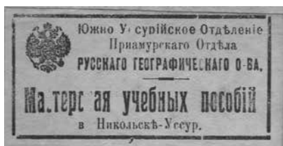
Рис. 3. Наклейка переплетной мастерской ЮУО РГО

Клавдиевич Арсеньев (1872–1930) – исследователь Дальнего Востока, путешественник, этнограф, писатель.