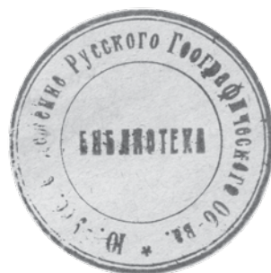
Рис. 2. Штамп библиотеки ЮУО РГО с текстом «Ю.-Усс. Отделение Русского Географического Об-ва. Библиотека»