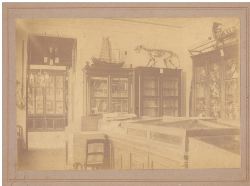
Музей Общества изучения Амурского края.