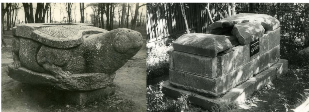
Археологические памятники из села Никольского (Уссурийск).

Ф.Ф. Буссе и В.П. Маргаритов совершили археологическую экспедицию «для раскопок древностей, коим угрожало уничтожение от потребностей жизни населения». Они отправились к устью р. Суйфун, в долину Лефу для раскопок древностей, которым угрожало уничтожение.