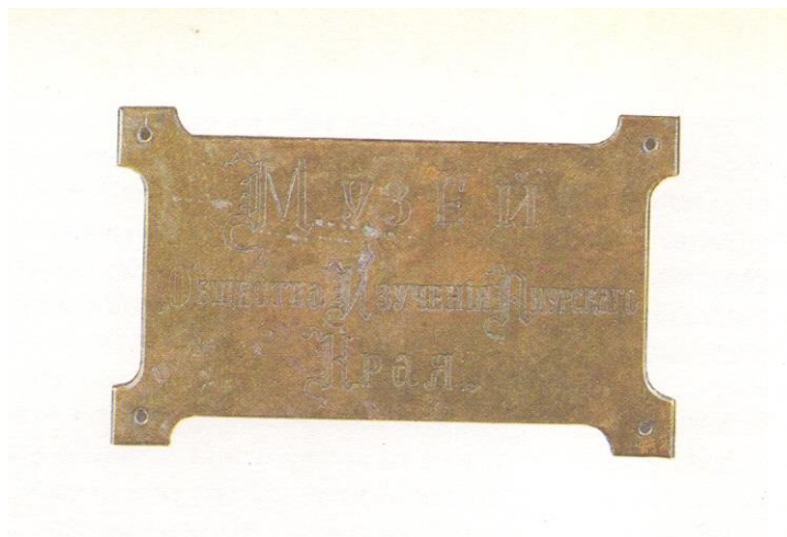
Медная табличка Музея Общества изучения Амурского края.

Ф.Ф. Буссе и В.П. Маргаритов совершили археологическую экспедицию «для раскопок древностей, коим угрожало уничтожение от потребностей жизни населения». Они отправились к устью р. Суйфун, в долину Лефу для раскопок древностей, которым угрожало уничтожение.