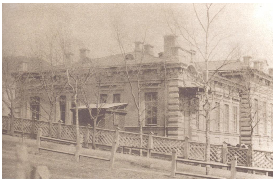
Музей ОИАК. Начало 20-го века.