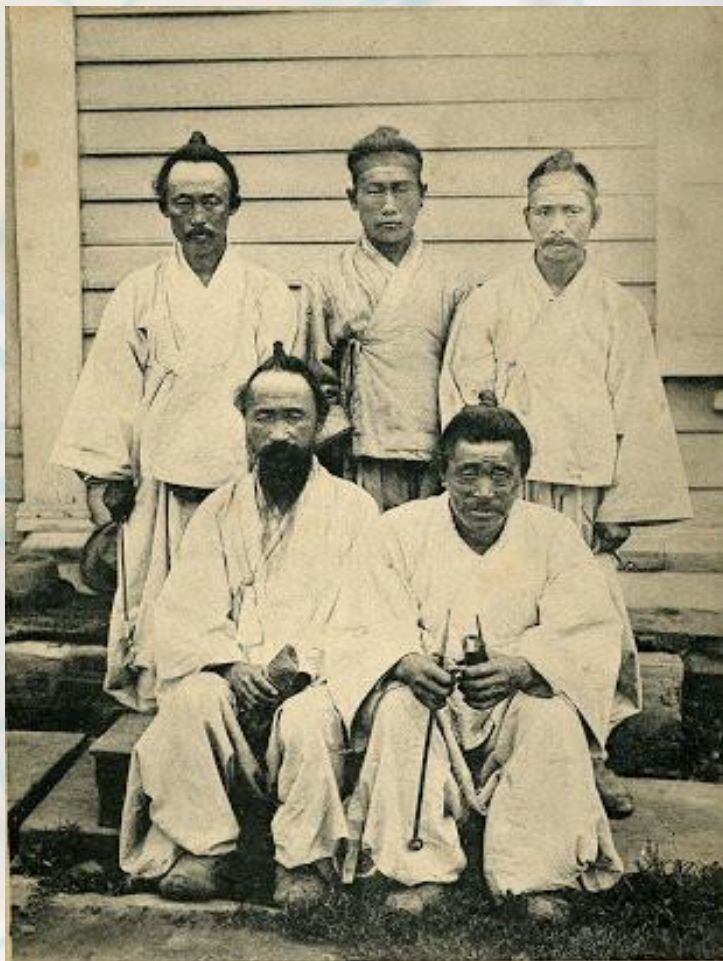
Типы Владивостока.—Types de Vladivostok. № 21. Корейцы.—Les Coréens.