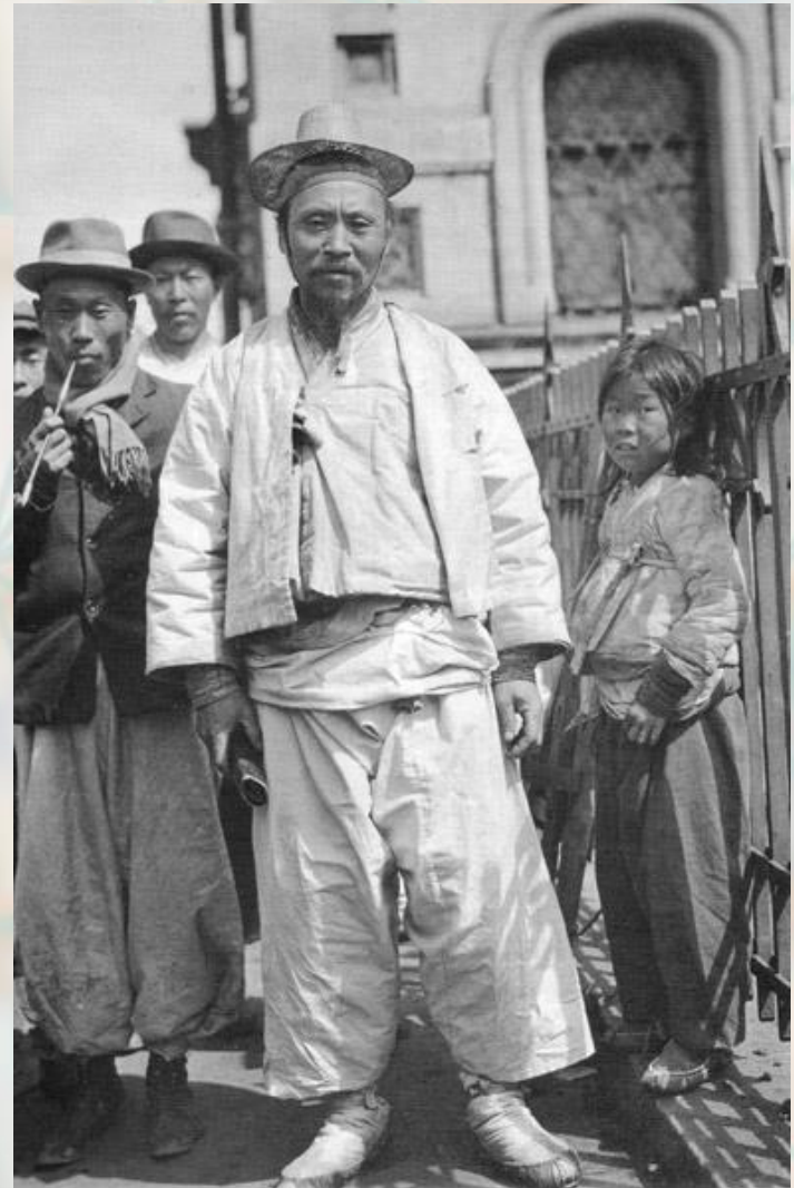
Корейцы в праздничных костюмах

В. Песоцким был пройден основной маршрут "просачивания" корейцев в Россию, включая корейские пограничные города и районы, пограничные караулы, переправу и основные места их вселения в России.