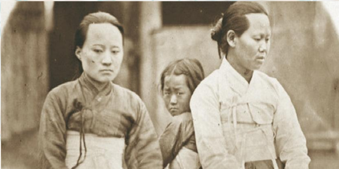
Корейские переселенцы.

Интересно, что отчет В. Граве был доступен широкой аудитории, а материалы В. Песоцкого имели гриф секретности. Причины получения грифа секретности последнего документа в работе не раскрываются. Вероятно, это было связано с "неофициальным" (возможно нелегальным) пересечением корейской границы с целью сбора необходимых сведений, т.к. вопросы, касающиеся корейцев, затрагивали политические интересы уже не столько Кореи, сколько Японии, в силу потери суверенитета первой.