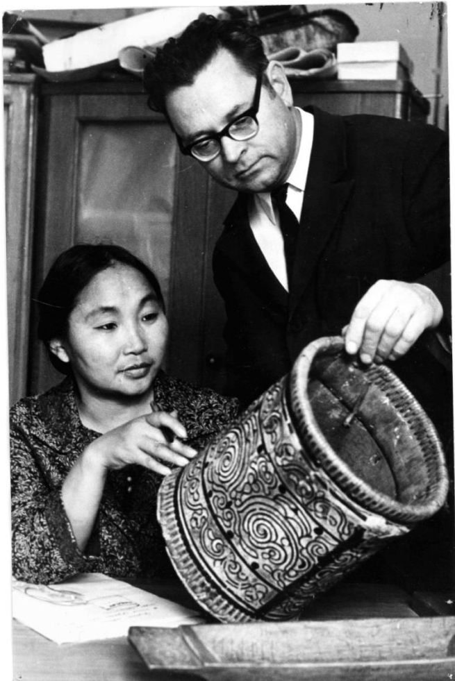
Сектор этнографии Института истории, археологии этнографии народов Дальнего Востока ДВНЦ АН изучает быт и культуру малых народов Дальнего